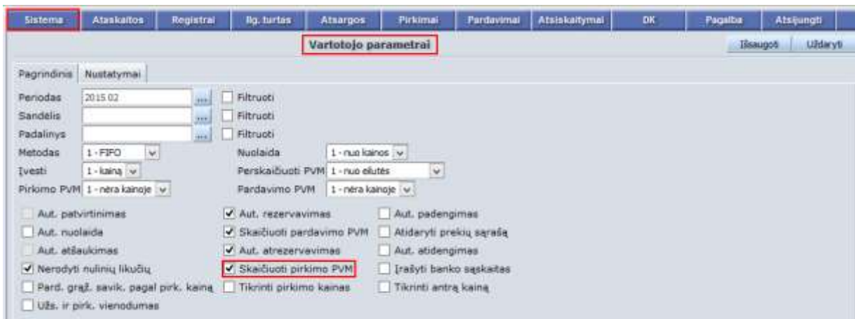
4 pav. Skaičiuoti pirkimo PVM