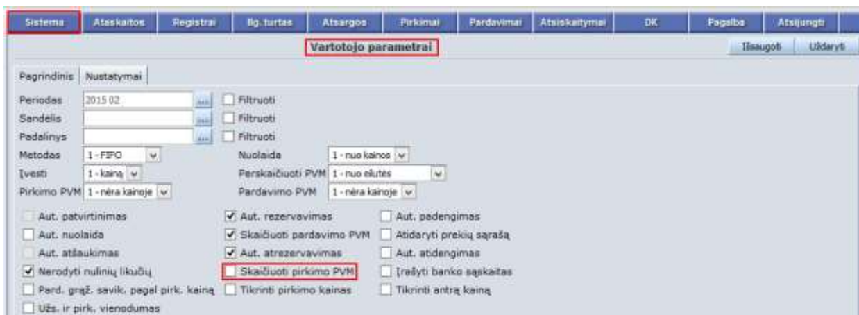
5 pav. Neskačiuoti pirkimo PVM