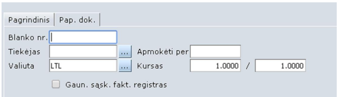
6 pav. Papildomo dokumento eilučių pildymas

nurodykite jo Nr., tiekėją bei valiutą, jeigu ji skiriasi nuo prekių įsigijimo valiutos (6 pav.).